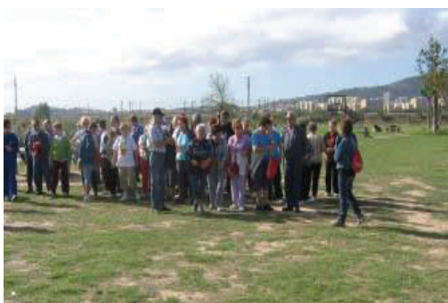
Marxa de la Gent Gran de Sant Joan Despí

Caminem per un envelliment actiu. Som gent gran activa, amb ànsies de coneixement i de voler seguir contribuint al benestar social. Hem de fer esport i animar a totes i tots a fer-ho, a córrer, a nedar, a jugar, a fer passejades. Fer esport millora el nostre estat d'ànim, ens relaciona amb els altres i amb el medi, ens ajuda a mantenir-nos sans i possibilita que a mesura que envellim ho fem en les millors condicions possibles.