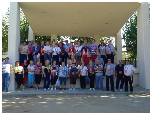
Marxa de la Gent Gran de Sant Andreu de la Barca