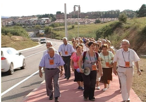
Marxa de la Gent Gran d'Esparreguera