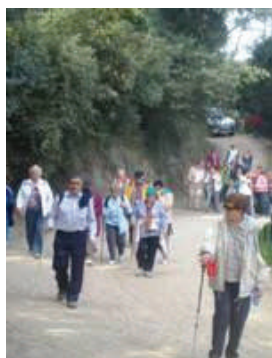
Marxa de la Gent Gran de Molins de Rei