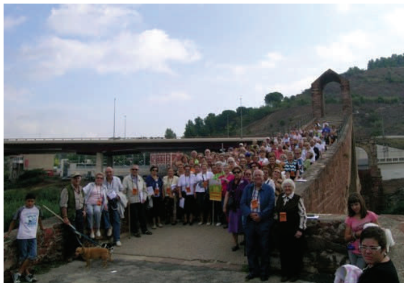
Marxa de la Gent Gran de Martorell