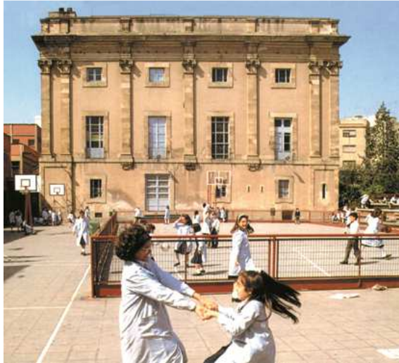
5. Pubilla Casas. Façana de la Pubilla Casas, immoble catalogat de l'Hospitalet, del segle XVIII, que va ser objecte de diverses escaramusses bèl·liques durant la Guerra del Francès. Actualment és una escola privada.